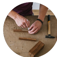
PRÁCE SE DŘEVEM